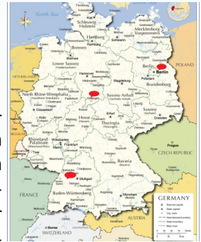
Vorträge in verschiedenen Gemeinden in Deutschland

In Peru dauern die Schuljahre von März bis Weihnachten und die großen Sommerferien sind im Januar und Februar. Somit können die Kinder und ich (Christina) dieses Schuljahr noch gut abschließen und ich kann meine Klassen verabschieden, da ich nächstes Schuljahr aufgrund unseres Babys erst einmal nicht unterrichten werde. Stattdessen plane ich andere Projekte der Schule als Umwelt-Beauftragte zu unterstützen