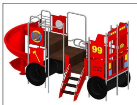
Ein geplantes Spielgerät für den neuen Spielplatz