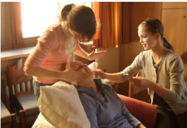
Drei Mädchen: Fürsorge einmal anders...

Aber damit der Ernst des Lebens nicht immer an erster Stelle steht, wird auch ordentlich „wohlgeföhlt“ mit Massagen, Peelings, Masken und Gurkenscheibchen für die Äuglein.