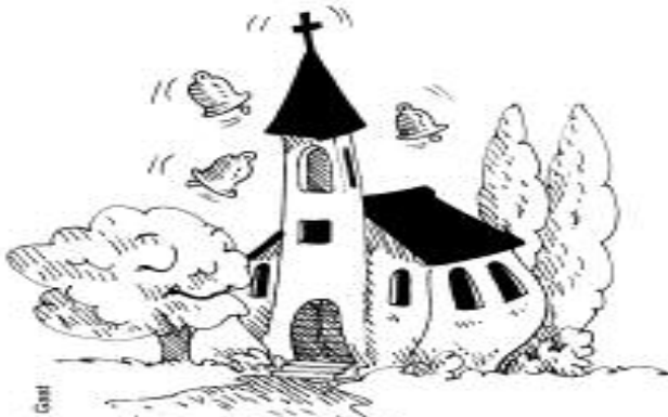
Volles Haus. Wir freuen uns auf Sie!

So viele Menschen gibt es in Stadt und Land, die keine Ahnung von Gott, Christus, Glauben und Gemeinde haben. Dabei sind ziemlich viele von ihnen sogar religiös sehr interessiert! Andere suchen aufgrund ihrer Lebenssituation nach Orientierung und Hilfe. Manche von ihnen schauen bei uns in den Gottesdiensten herein, ihnen wollen wir einladend begegnen.