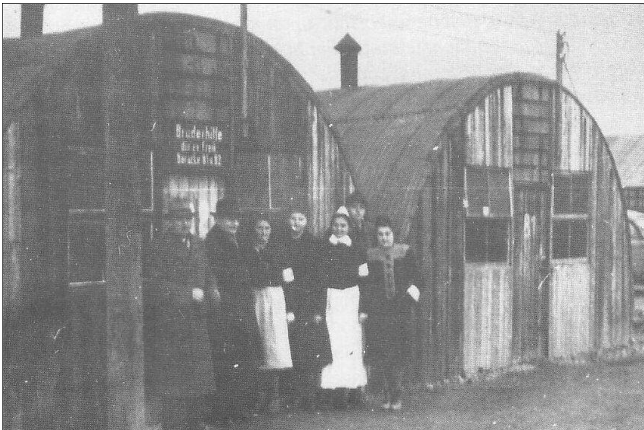
Die Bruderhilfe der Baptistengemeinde Göttingen 1948, Baracke 82

genbrachtensichindieArbeitsdortein.N ben der persönlichen und materiellen U terstützungnahm diese seelsorgerliche Arbeit unter den verzweifelten und entwurzelten Menschen breiten Raum ein. Lagergottes dienste wurden eingerichtet und gestaltet. Unter freiem Himmel und in engen Wel blechbaracken, in denen 100 Menschen schlecht untergebracht werden konnten, fanden Lob und Dankgottesdienste statt. Ab 1946 konnte auch die neuerrichtete L agerkapelle genutzt werden. Die Chormitgli der der Gemeinde Göttingen waren stets zur Stelle, wenn gerufen wurde. Es g schah häufig, dass innerhalb weniger Stu den ein Bus mit Choristen nach Friedland geholt wurde, damit sie die Gottesdienste durch Lied und Zeugnis vertieften. So hatte die kleine „Bruderhilfe“ bald, ohne es zu wollen, alle durch ihre größere Beweglic keit die Initiative in der gottesdienstlichen Betreuung übernommen. Im Herbst 1946 ließ der Strom der Flüchtlinge und Vertri benen langsam nach. Dafür wechselten bald die Heimkehrer aus westlicher und öst-